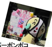
スーパーポンポ ジャガピーにしなり くん