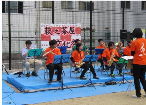
いまみや こうか こうこう 今宮工科高校ブラスバンドによる演奏