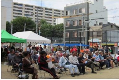
かいじょう ふうけい 会場 風景