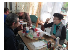
かいようしつ 2階洋室 にがおえ 似顔絵コーナー