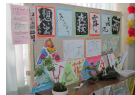
こ バルーンアートと子どもたちと三徳 寮 音楽クラブの皆さん てんじ さくひん いちぶ 展示作品の一部