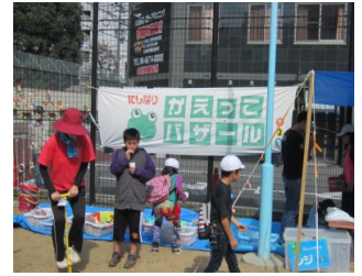
かえっこ バザールのコーナー