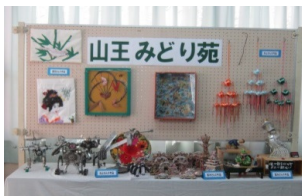
にしなり しみんかん かいぎしつ 西成市民館・会議室