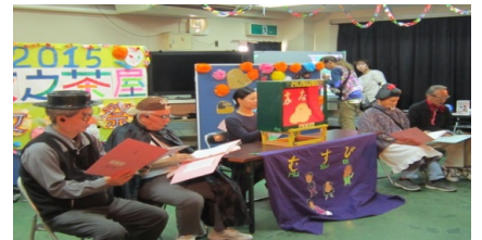
かみ しはいげき 紙芝居劇