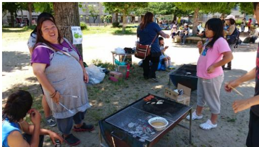
いつもの焼き焼き！ あつかった～