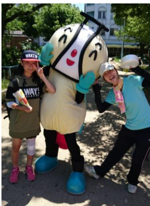
人気のジャガピーくん！ パジャリ！