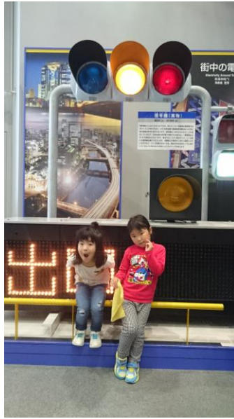
しんごうって 大きいな～