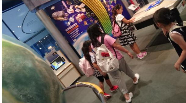
ふむふむ。へんきょうちゅう！