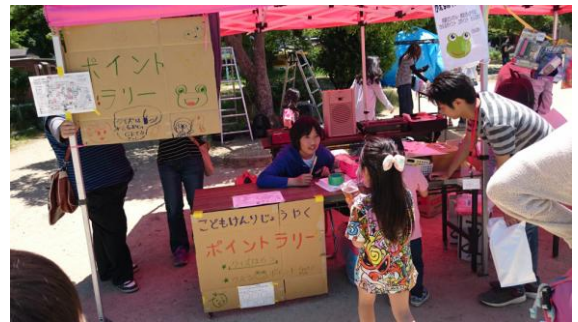
まつりのことは なんでもきいて！