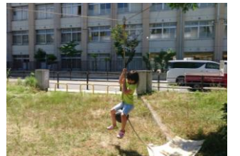
ターザンロープで ア～アア～