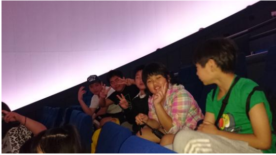
もうすぐプラネタリウム！