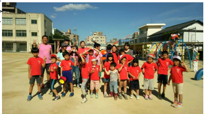
チーム今池 ハイチ～ズ！