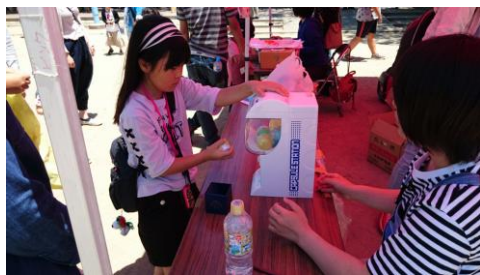
ミニガチャガチャ 大にんき！