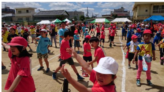
まずはラジオたいそうから！