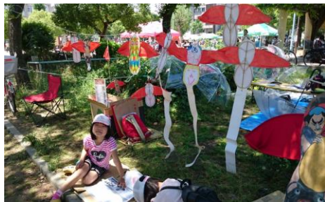
こつまいかを ぬりぬり～