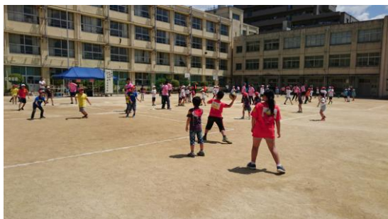
パスをまわして こうげきだ！

あつい中みんな さいごまで がんばりました！ 中高生スタッフも 大かつやくの一日でした！