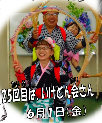
25回目は、いしとん会さん 6月1日(金)