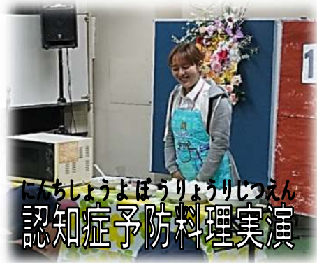
にんちしょうよぼうりょうりじつえん 認知症予防料理実演