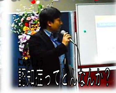
認知症ってどんなか?