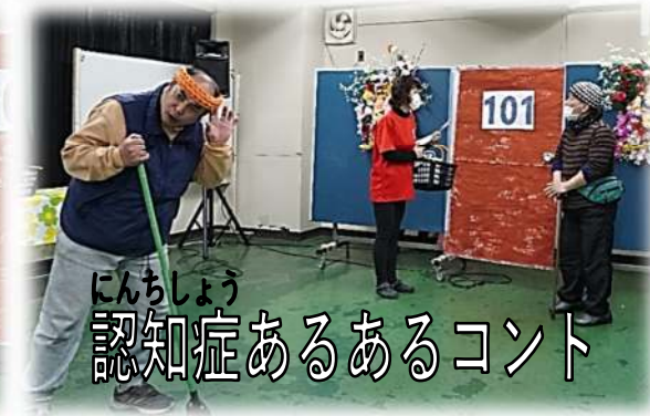
にんちしょう 認知症あるあるコント