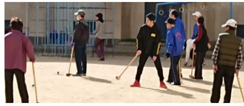
地域のグランドゴルフ大会