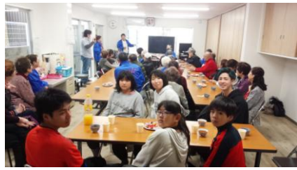
お楽しみランチ会