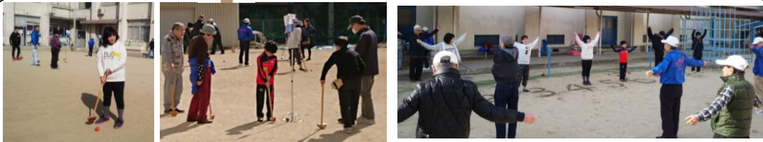
早朝のラジオ体操