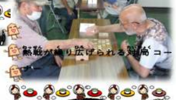
熱戦が繰り広げられる対局コー

イオリ&くろべさんに、今回はイカ様も加わって、楽しさ3倍!(^_^)!懐かしの昭和歌謡と、笑い満載のひと時でした。ありがとうございました(^_^)