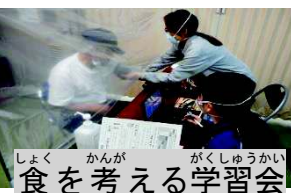
食を考へる学習会