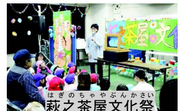
萩のちややぶんかさい 萩之茶屋文化祭

西成市民館は、今年度で、大阪市指定管理者としての期間が終了するようになっていりましたが、新たな選定の結果、2026年までの5年間、再度、管理を委託されることとなりました。それに伴い、