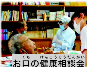
お口の健康相談会