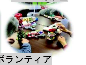
わっかボランティア