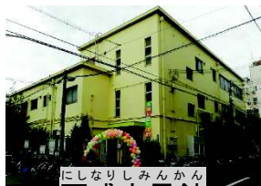
にしなりしみんかん 西成市民館

西成市民館は、今年度で、大阪市指定管理者としての期間が終了するようになっていりましたが、新たな選定の結果、2026年までの5年間、再度、管理を委託されることとなりました。それに伴い、