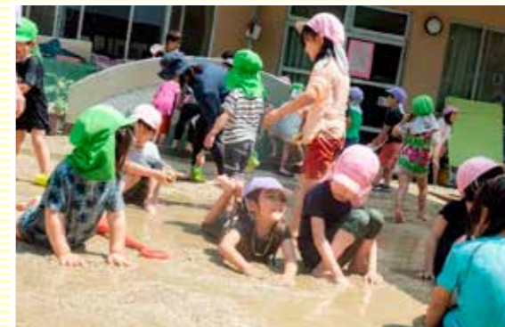
「え~い、ねころんじゃえ~」