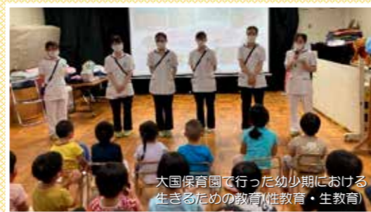
大国保育園で行った幼少期における生きるための教育(性教育・生教育)

「あかちゃんは、とても頑張って生まれてきました」「あかちゃんには周りの人を笑顔(幸福)にする力があるんですよ」と助産師さんが優しく子どもたちに語りかけてくれました。そして、すべての子どもは、力のある存在。あなたは、そんな大切な存在であり、隣にいる友だちもみんな大切な存在なんだよ、という命の授業でした。