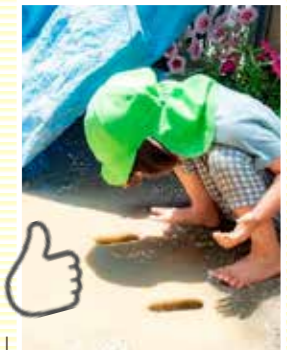
「泥水、どこに流れていくんやろ?」