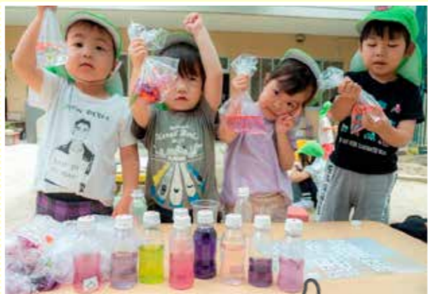
すてきなジュースがたくさんできたよ!! 「ジュースやさん、オープンしま~す」