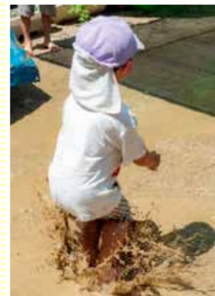
「水たまりジャンプ! これが楽しいよなー」