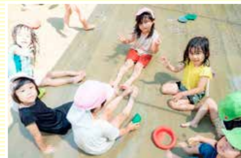
「おひさまありがとう~ 泥んこ温泉あったかいね~」