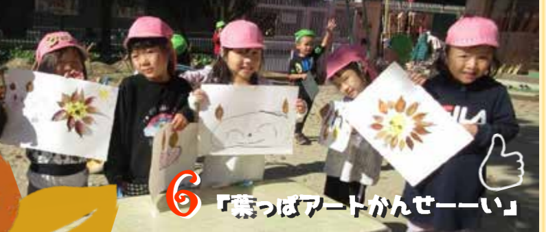
葉っぱを魚に見立てて 魚つり