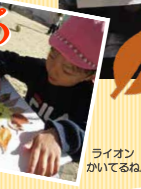
ライオン かいてるねん