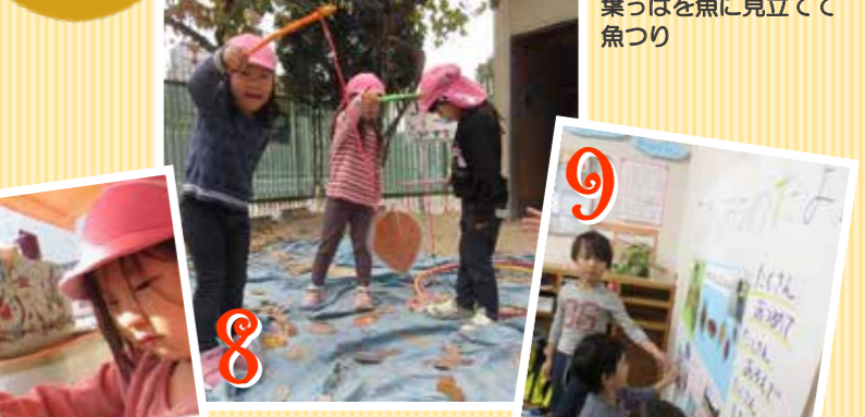
これとこれ、 全然ちがうなあ♪