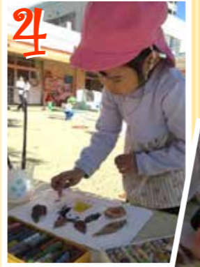
なにになるでしょーが